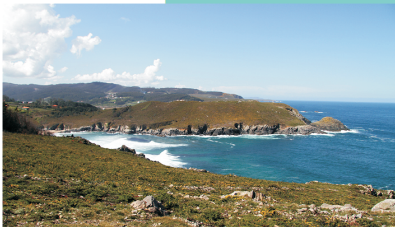
Vista sobre a enseada de Baleo e a punta Torrella