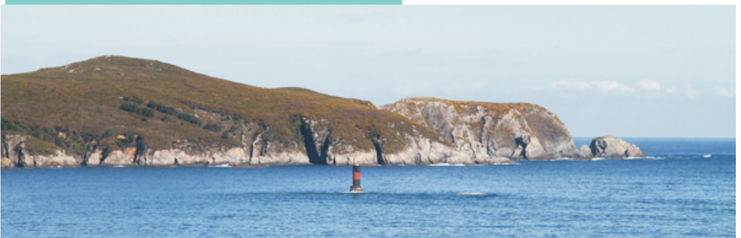
Punta Chirlateira desde Punta Robaleira