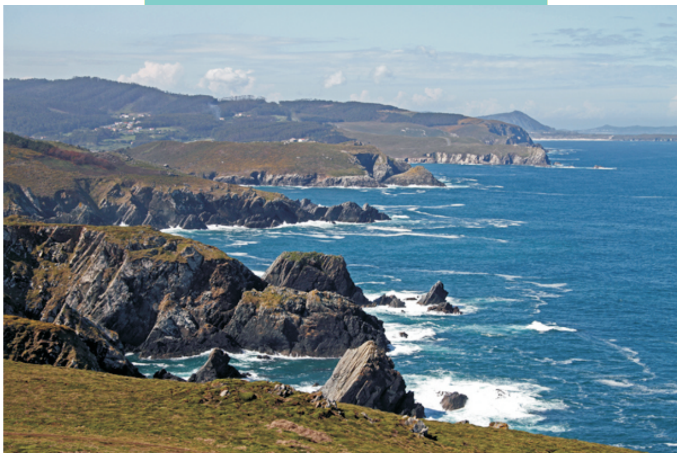
Vista cara ao sur