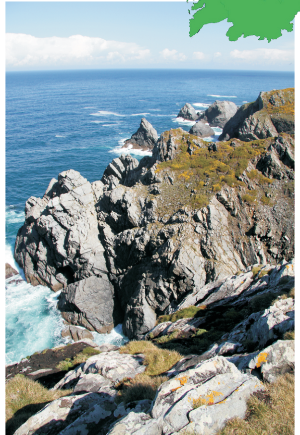
Cantís da punta Chirlateira

Un percorrido pola punta que couda os embates do océano na ría de Cedeira. Unha área despexada con fortes cantís e amplas panorámicas sobre a ría de Cedeira, os arranques da Capelada cara ao norte e os saíntes da costa accidentada cara ao sur ata cabo Prior.