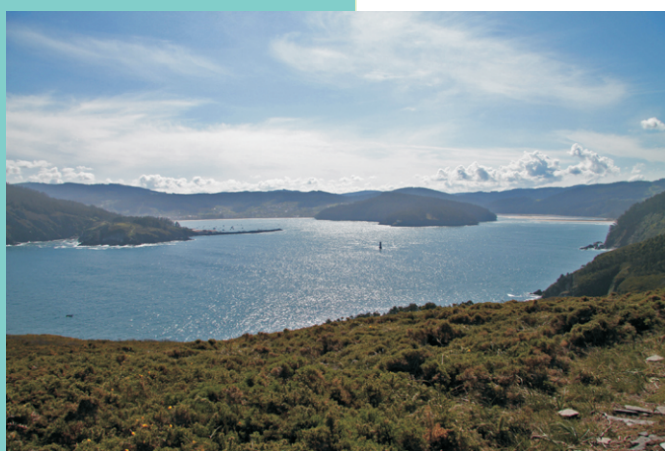
Vista sobre a Ría de Cedeira