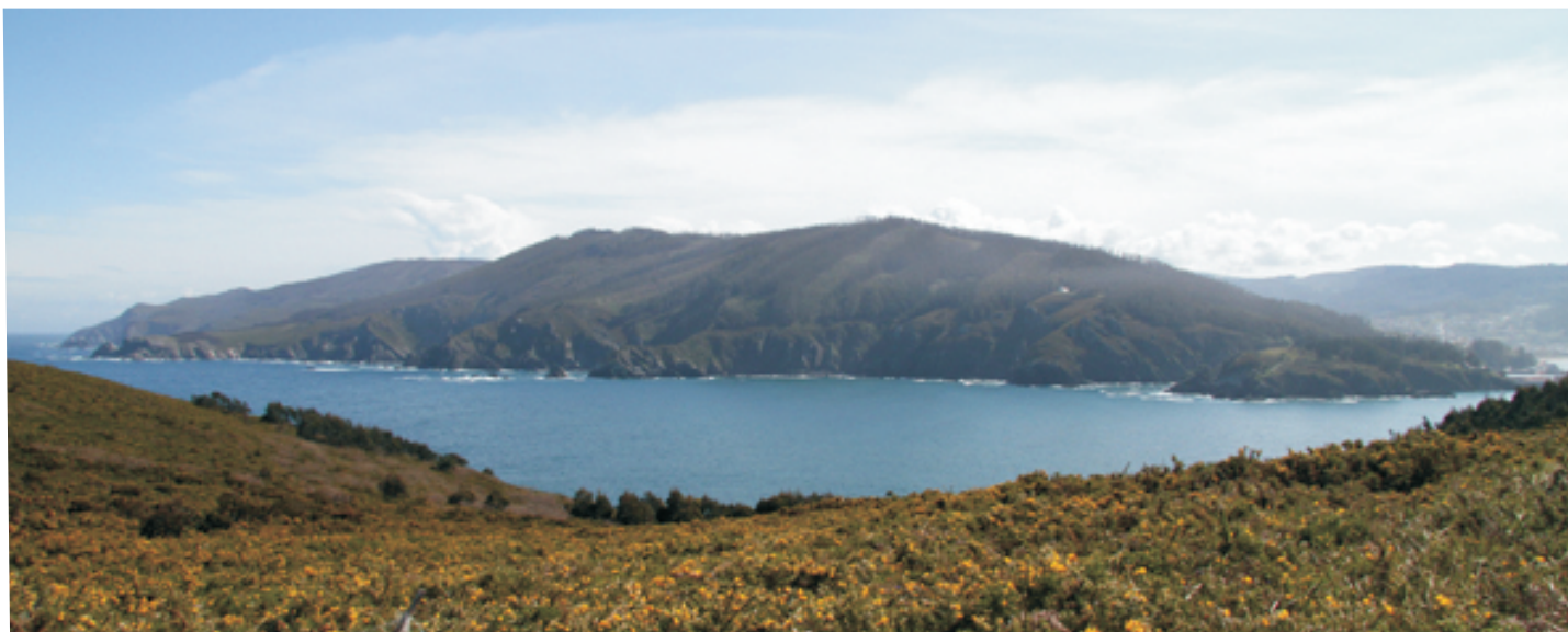
Vista sobre a costa exterior de Cedeira